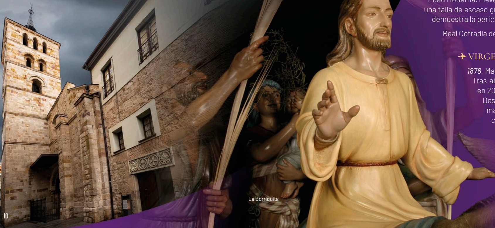
Cristo de la Buena Muerte

Hermandad Penitencial del Santísimo Cristo de la Buena Muerte.