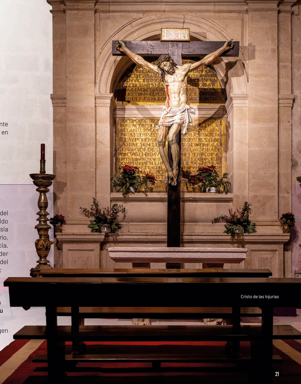
Cristo de las Injurias

Antes de concluir el recorrido hay que cruzar el Duero para visitar, en la margen izquierda del río, la iglesia de San Frontis [6] , donde cada año empieza la Semana Santa de Zamora con el Traslado del Nazareno (“Jesús del Vía Crucis”, s.XVII).