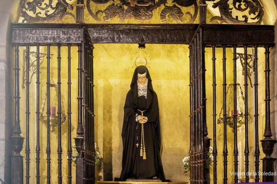
Virgen de la Soledad

Cofradía de la Santa Vera Cruz, Disciplina y Penitencia.